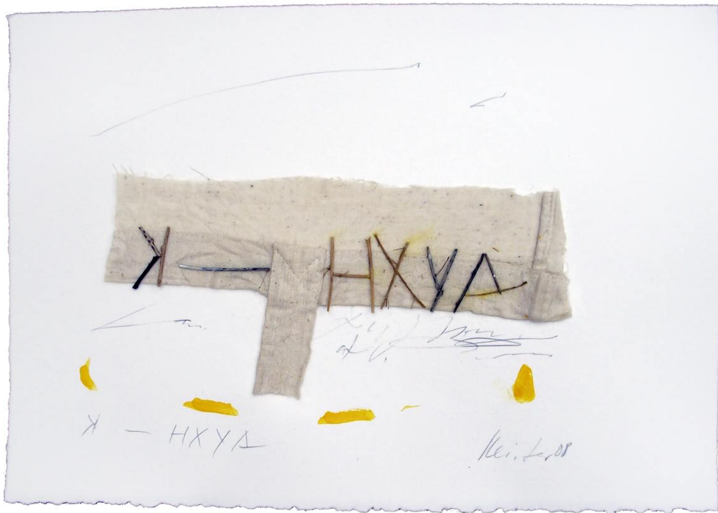
„K-HXYA“, 2008, Mischtechnik auf Bütten