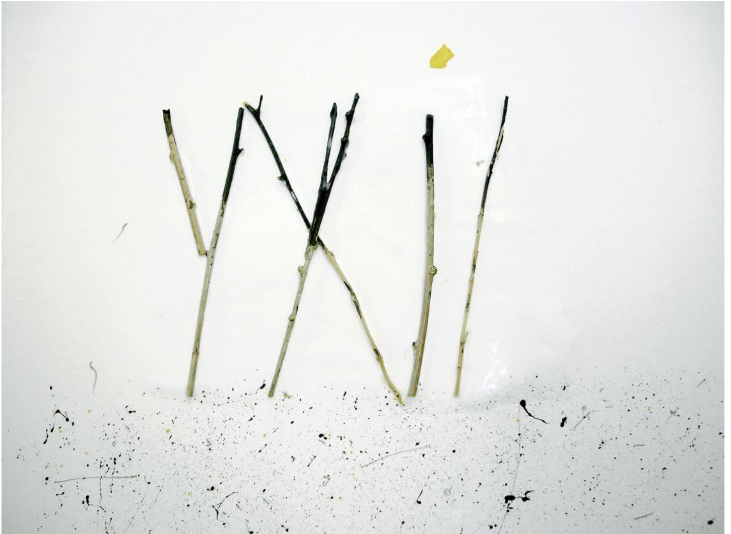
„Das große Tor“, 2008, Mischtechnik auf Bütten, 14 x 19