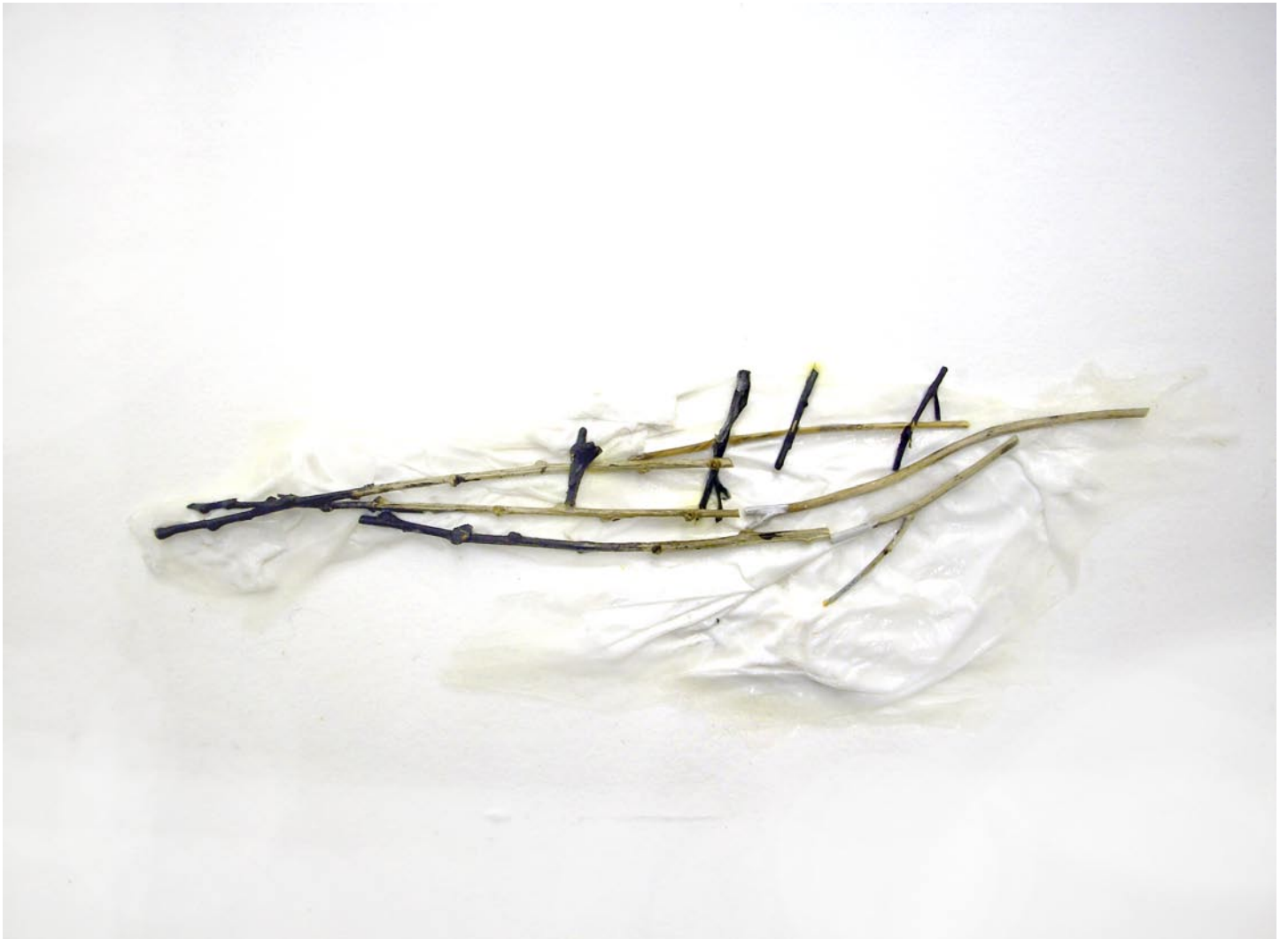
„Das Boot“, 2008, Mischtechnik auf Büttchen, 14 x 19 cm