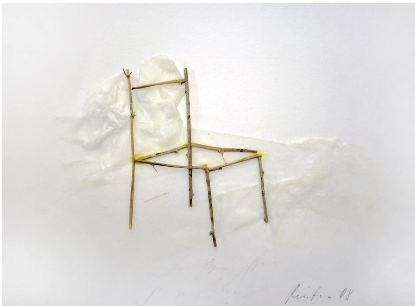
„DER Stuhl“, 2008, Mischtechnik auf Bütten, 14 x 19 cm