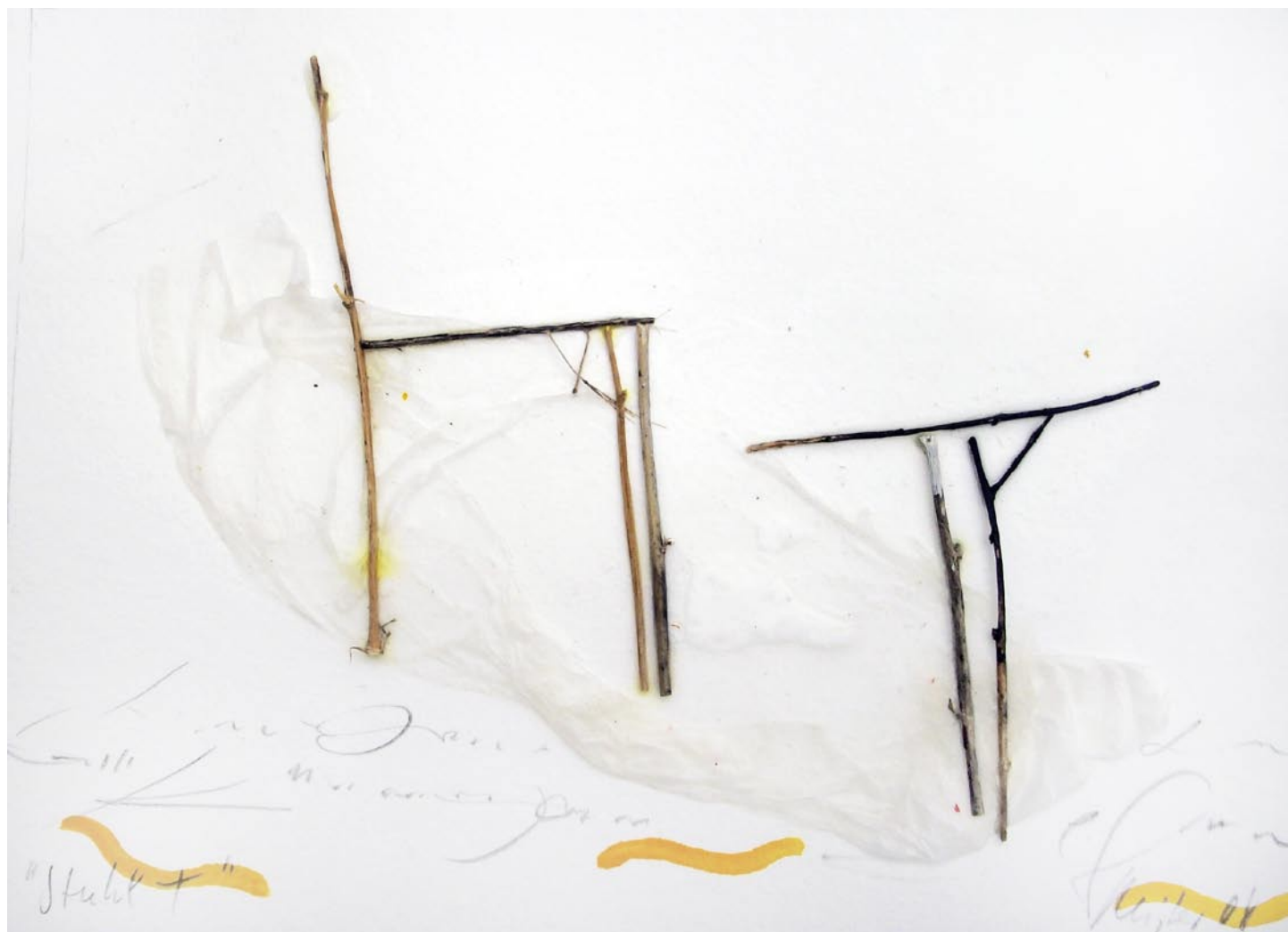
„Stuhl +“, 2008, Mischtechnik auf Bütten, 14 x 19