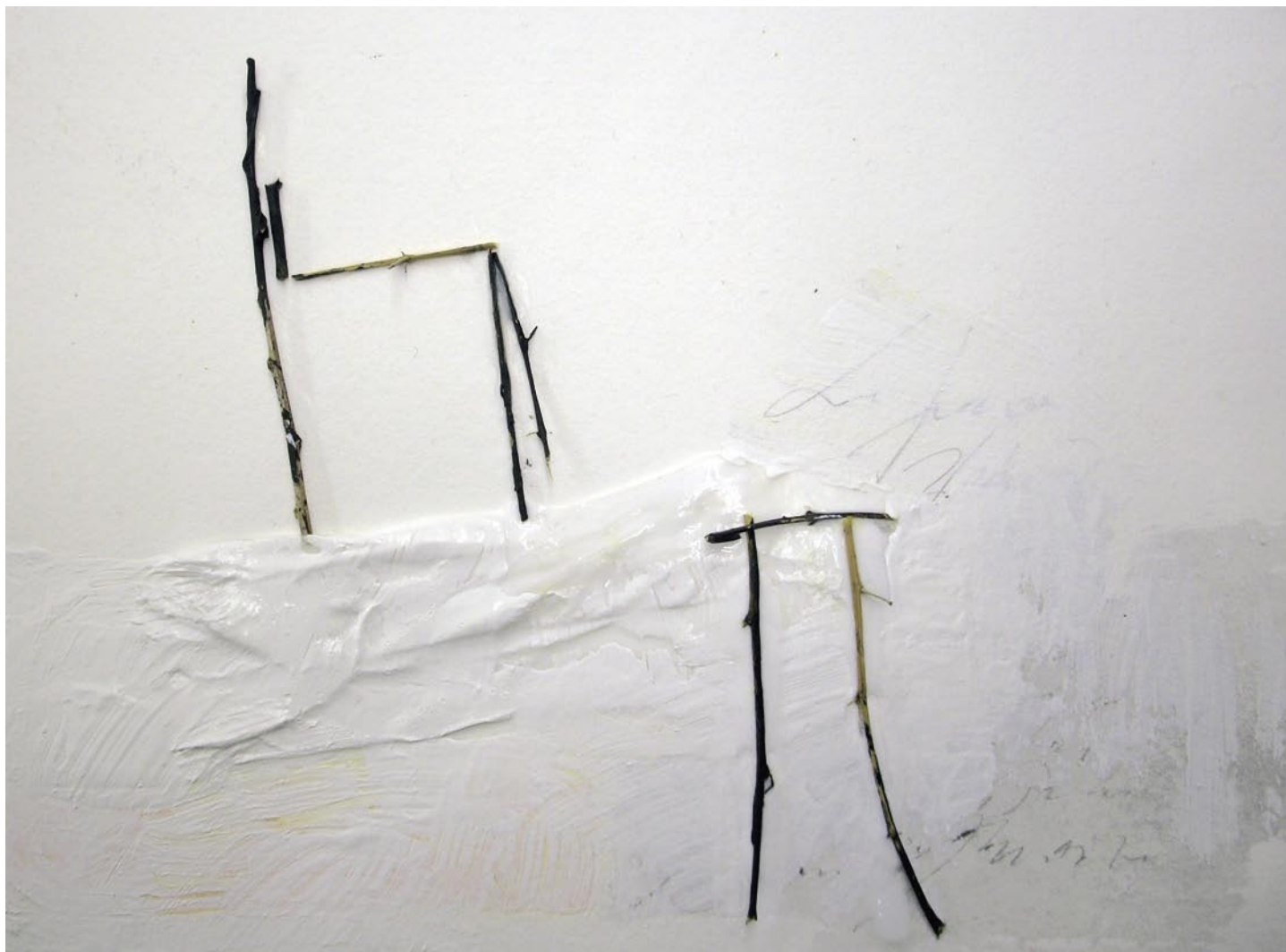
„Erinnerungen“, 2008, Mischtechnik auf Bütten, 14 x 19