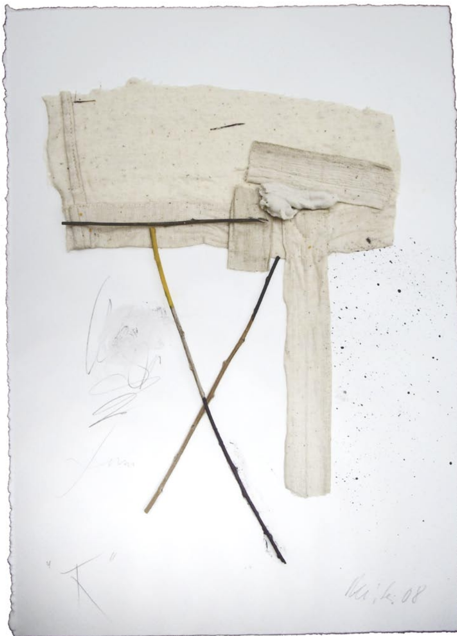
„TX“, 2008, Mischtechnik auf Bütten