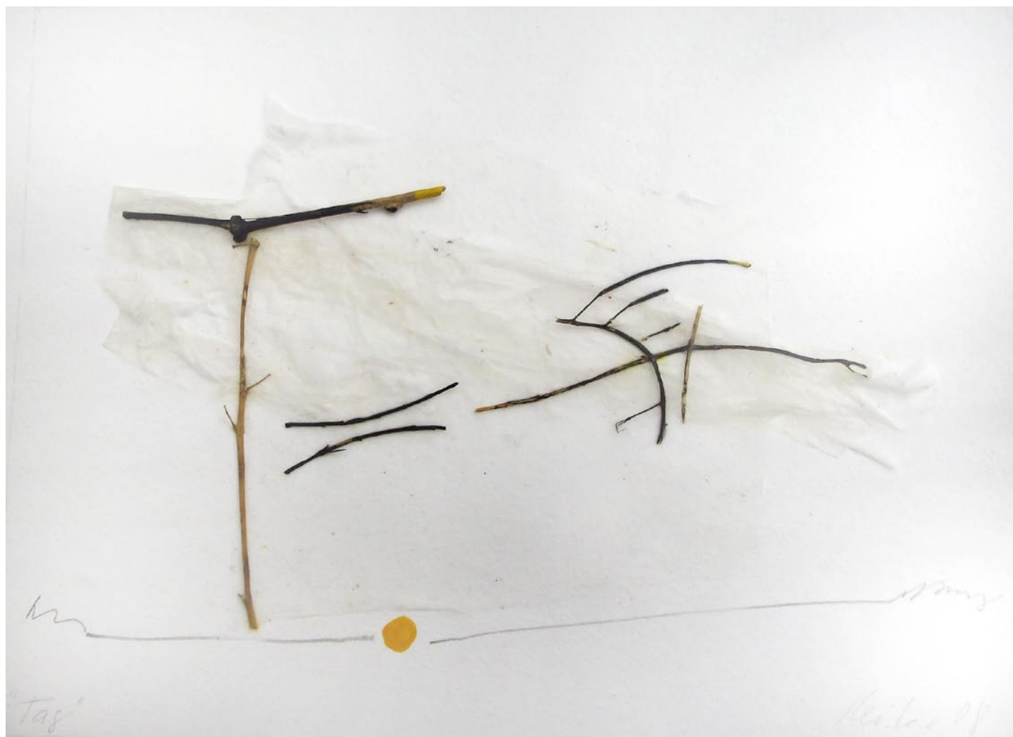
„Tag, 2008, Mischtechnik auf Bütten, 14 x 19 cm