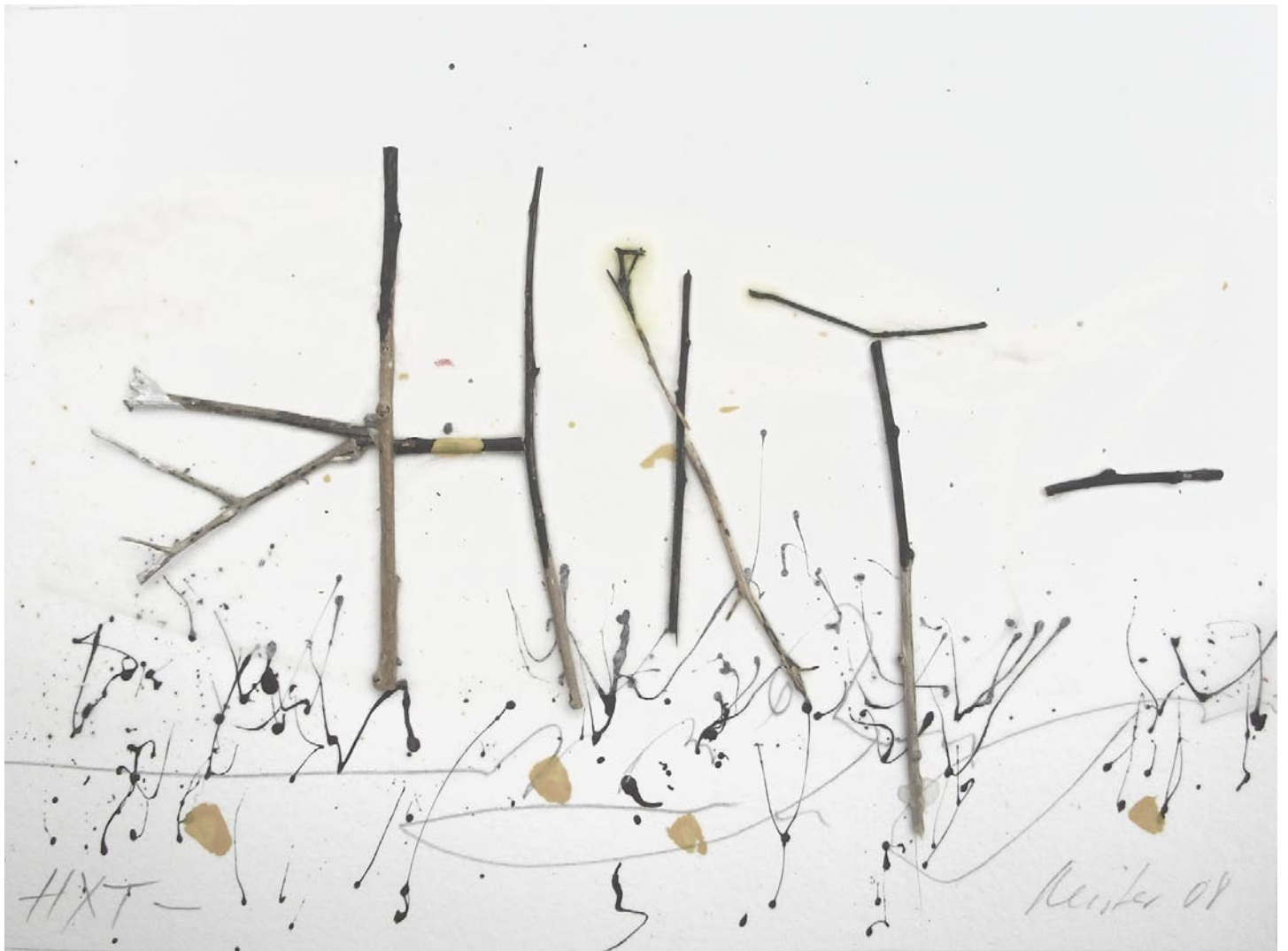
„HXT-“, 2008, Mischtechnik auf Bütten, 14 x 19 cm