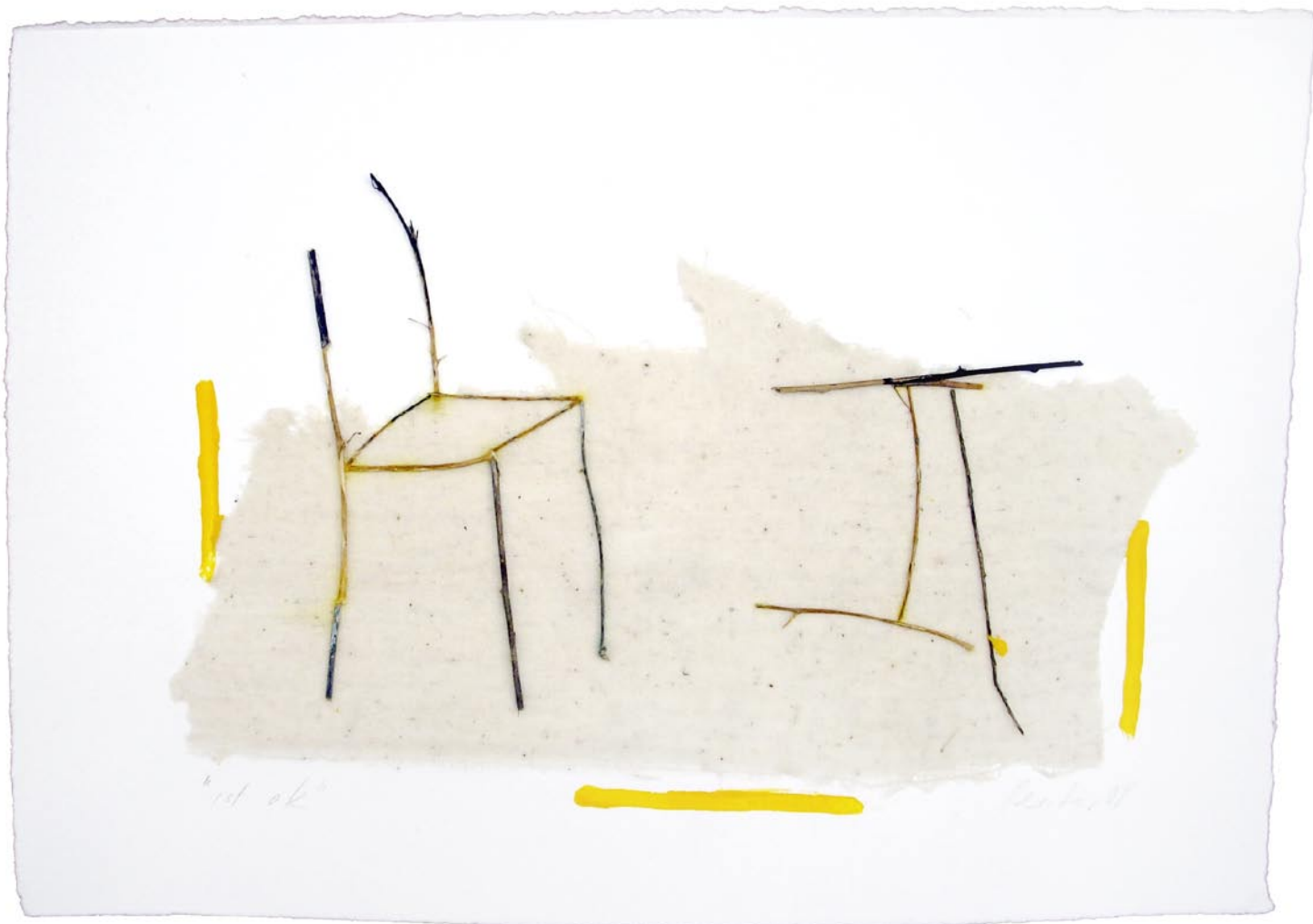
„ist ok“, 2008, Mischtechnik auf Bütten