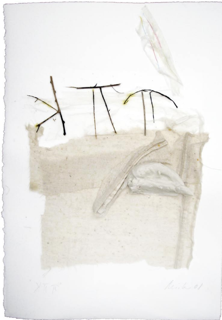
„KTT“, 2008, Mischtechnik auf Bütten