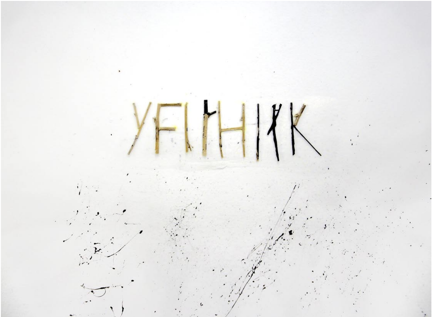
„Ich kannte IHN“, 2008, Mischtechnik auf Bütten, 14 x 19 cm