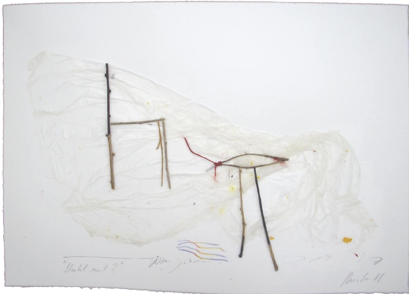
„Stuhl mit ?“, 2008, Mischtechnik auf Büten